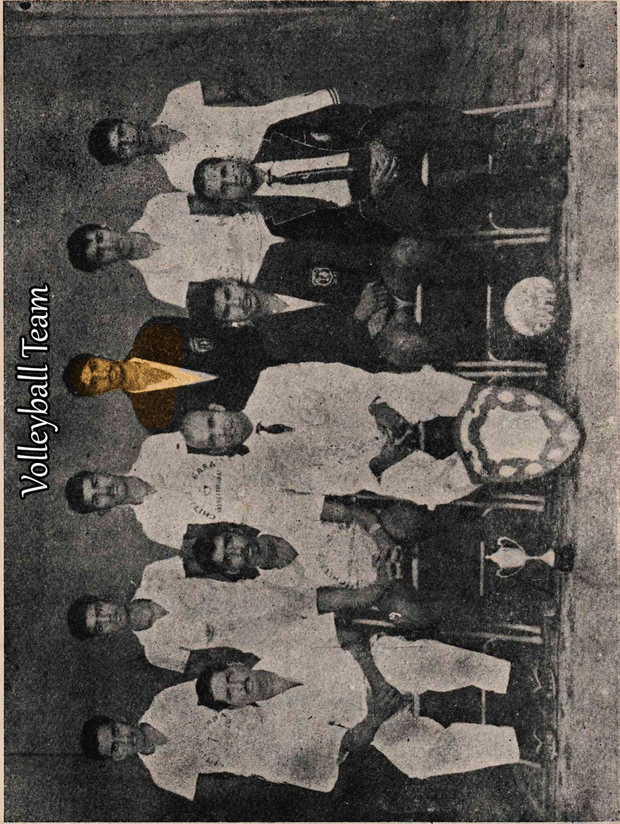
Vadamaradchy Champions from 1961 - 1966 All Jaffna Champions from 1964 - 1966